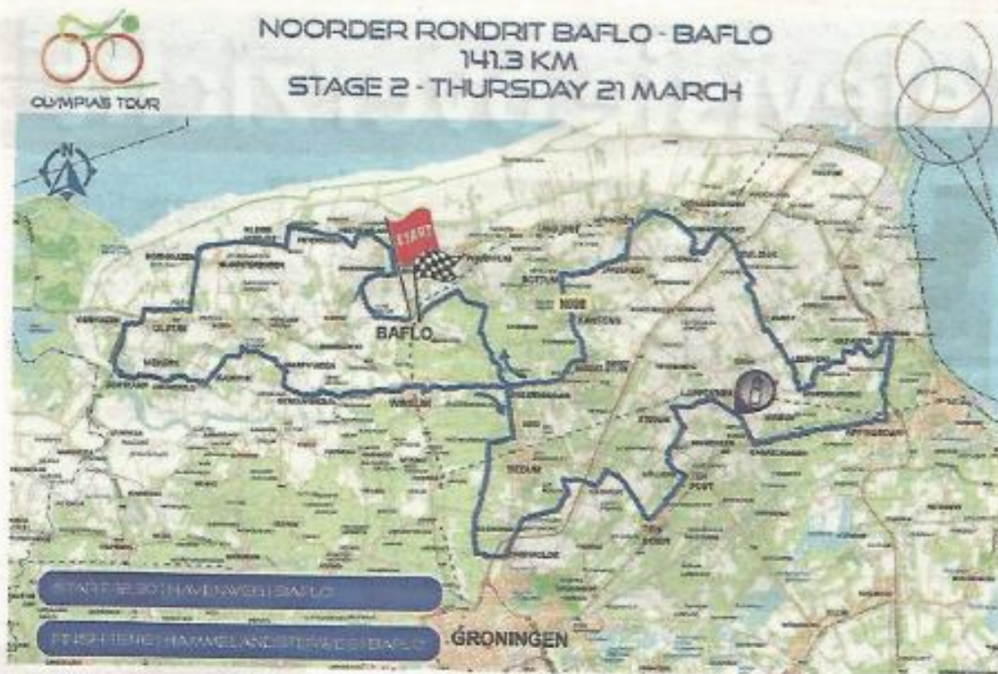
■ Het routekaartje van de etappe in Noord-Groningen.