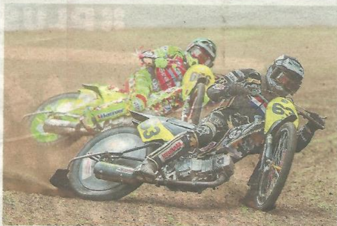
■ Tijdens de Semi Finale EK solo komt de Europese top in actie.