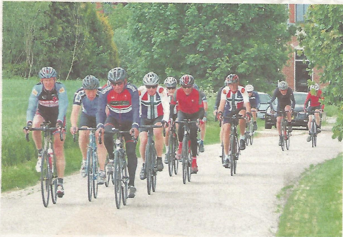
■ Deelnemers aan een vorige editie van de fietstocht.