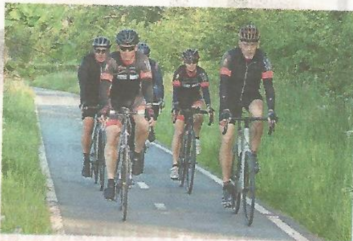
Deelnemers aan de Noorderrondrit verkennen het landschap.

MFAC Loppersum, dat dit in 2024 vijftig jaar bestaat, maakt zich nu op voor 8 juni als in Loppersum de TAMOIL Semi Finale EK Solo 's Grasbaanraces en een wedstrijd in de Internationale Zijspanklasse worden verreden.