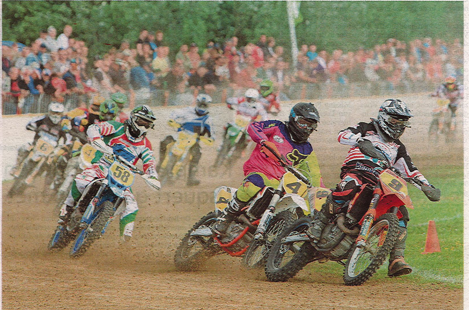
■ De publieke belangstelling voor de races in Loppersum is altijd groot. Ook hier in 2014 bij de ST250 cc.