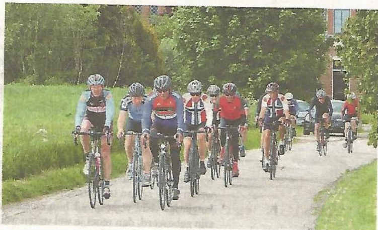
Toerfietzers tijdens de rit van vorig jaar.

Voor de prestatietoertochten van 145 en 85 kilometer kan er worden