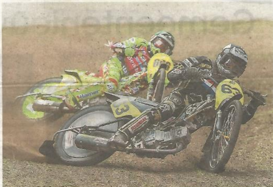
Strijd in de soloklasse.