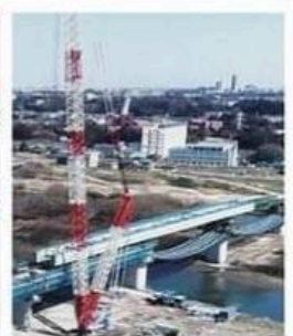
工事中の三郷流山橋

おおたかの森駅周辺から新三郷駅周辺の約9km。三郷市や流山市は人口増加、大型商業施設等の進出により交通需要が急速に高まっています。しかし、三郷市と流山市を往来できる橋は「流山橋」しかなく平日休日問わず渋滞が大きな課題でした。有料道路事業を採用することにより約5年という短期間で橋を完成させ、早期に交通課題を解決すべく道路整備を進めています。