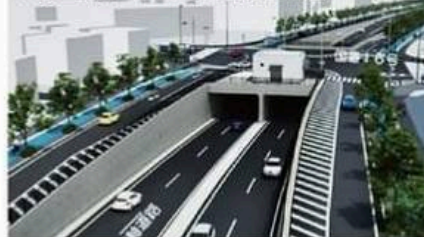
十余二船戸トンネル完成予想図