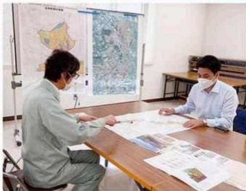
担当者から説明を聴く松崎県議