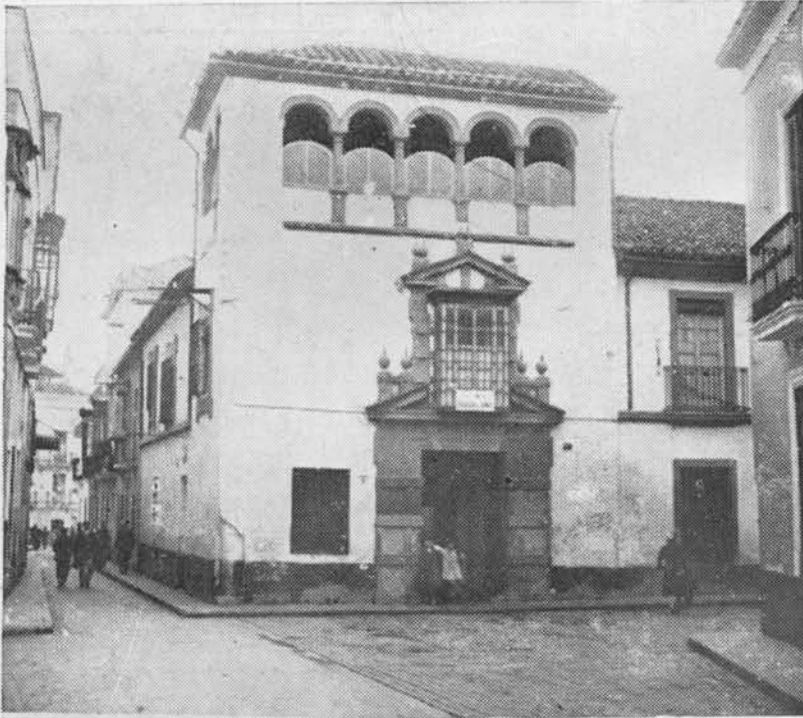
Fig. 24). Casa de la actual calle de Barroso, en que estuvo hasta principios del siglo XVIII el Hospital de San Juan y San Jacinto.

Fué el fundador de este hospital el hermano Pedro del Castillo, quien, viendo los muchos pobres que morían faltos de toda asistencia, solicitó y obtuvo del Obispo don Pedro de Portocarrero, le cediese el hospital antiguo de San Juan y San Simón y San Judas, para recoger allí los enfermos incurables, continuando de este modo su tradición primitiva.