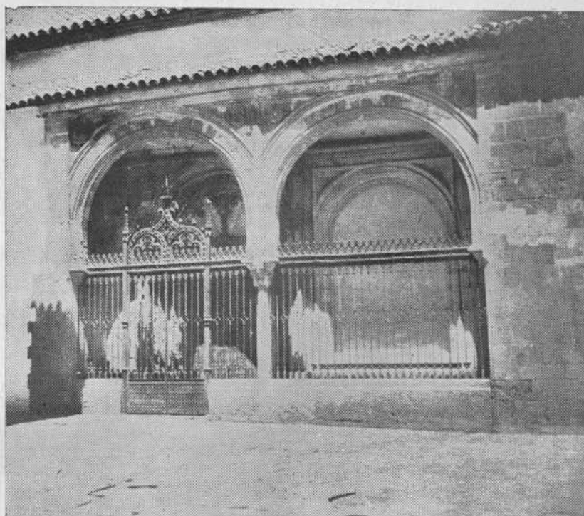
(Fig. 15.) Hospital de la Caridad. La fotografía reproduce las arcadas recientemente descubiertas que formaban el primitivo vestíbulo del Hospital.