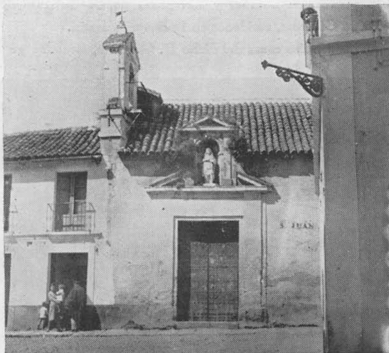
(Fig. 21.) Hospital de Villaviciosa. Vista de la Ermita que del mismo se conserva.

envergadura como las que aquí se mencionan, y precisamente para restaurar la enfermería, hay que concluir una de dos: o que las disposiciones del juez comisionado del Emperador no se cumplieron, o que el acuerdo tomado se revocó, a