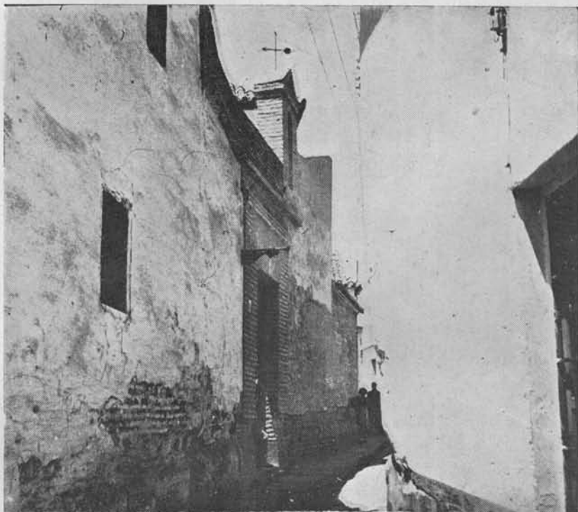
(Fig. 14.) Hospital de Santa Quitería. Hoy Sinagoga en restauración. Lo estrecho de la calle obligó a tomar la fotografía muy de costado.

Según afirma Ramírez de Arellano, en su tiempo aún celebrábanse algunos