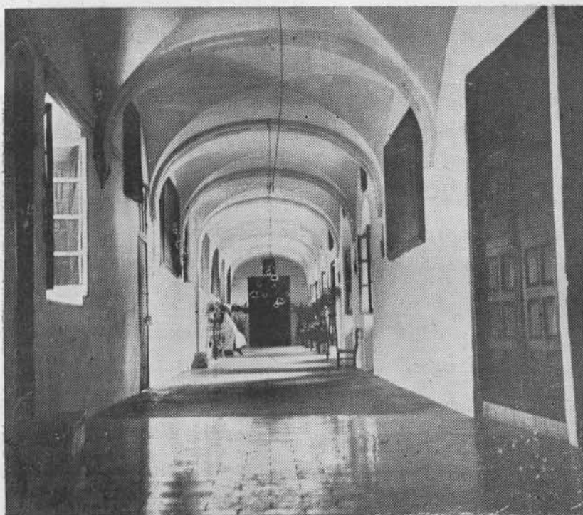
(Fig. 26). Vista de una galería del Hospital de S. Bartolomé y Jesús Nazareno.

agua que inundó los campos destrozando las sementeras, llegando a valer durante ellos la fanega de trigo ciento diez reales y la cebada sesenta y seis, precios exorbitantes para aquellos tiempos. A estos años de hambre siguió desde 1677 a 1682 peste que desde Cartagena y Murcia se corrió hasta Andalucía, no pudiendo evitarse que penetrara en Córdoba, en la cual se dió el primer caso en la calle de Pedregosa. Por ello, al ir saliendo de aquellos apuros el fundador, mirando los acontecimientos con espíritu providencialista y religioso, hizo colgar una tablilla ante la imagen de Jesús Nazareno en la que se leía: «Mi providencia y tu fé han de tener esto en pié».