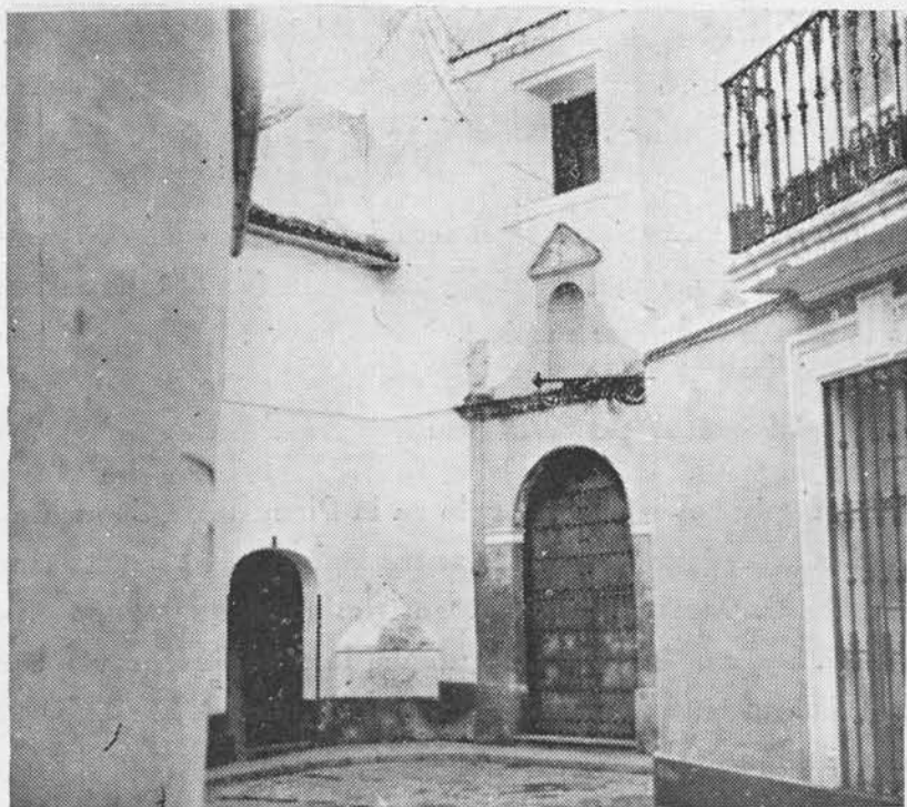
(Fig. 23). Puerta de la ermita de San Roque. A la izquierda puerta del actual convento del Buen Pastor, que fué hospital de San Julián.

He aquí los tres únicos datos que componen todo el caudal de noticias que se conservan acerca del hospital de San Julián, vulgarmente conocido por el nombre de Hospital de los Pajares: