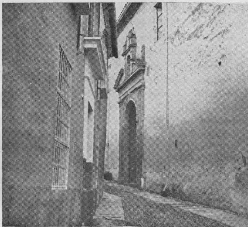
(Fig. 16.) Puerta principal de la iglesia del Hospital de Jesús Crucificado. La estrechez de la calle obligó a tomar la fotografía muy de costado.