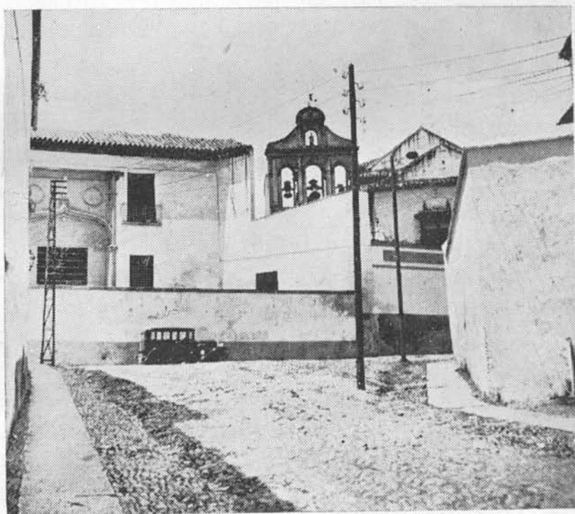
(Fig. 25). Hospital de S. Juan y S. Jacinto. Vista de conjunto—, iglesia campanario, edificaciones—, tomada desde la Cuesta del Bailío.

También en San Jacinto había, para el gobierno del hospital, una congregación de hermanos y otra de hermanas, viviendo éstas en clausura y gozando de los privilegios concedidos a los Servitas; siendo diez los primeros y veinticuatro las segundas, número que no ha sido fijo, sino que ha variado según las necesidades del hospital, como ha variado también el número de los asilados, aunque ordinariamente ha sido de treinta ancianos. En la fecha en que escribimos esta memoria siguen siendo en número aproximado de treinta los acogidos, no todos viejos, pues es suficiente el carácter de impedido. Las monjas, hermanas terciarias servitas, son dieciseis, con clausura episcopal. No hay ya hermanos, los cuales desaparecieron el año de 1914.