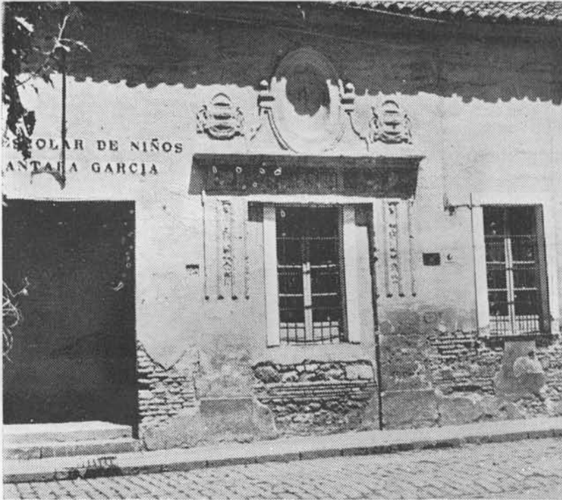
(Fig. 22.) Hospital de San Andrés (Condes de Gavia). Primer Emplazamiento. La ventana del centro de la fotografía fué indudablemente la puerta principal del mismo. Hoy grupo Escolar.

Fundóse en las propias casas del dicho D. Gonzalo, situadas en la calle de