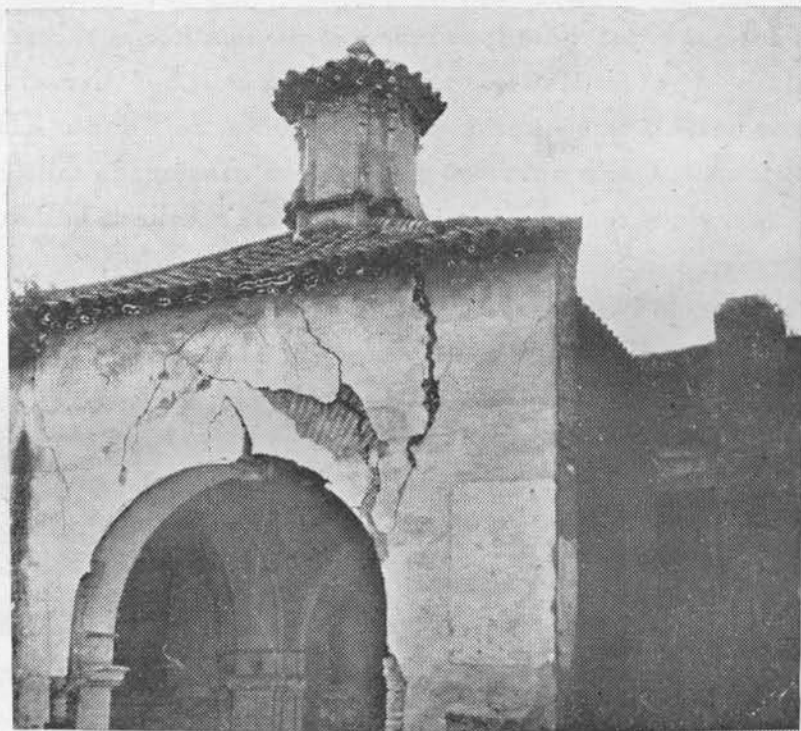
(Fig. 19.) Parte superior del Hospital en ruinas, de San Bartolomé. Puerta del Rincón, tal como hoy se conserva

«Muy rreverendo Señor: El prioste e cofrades del ospital del señor San Bar-