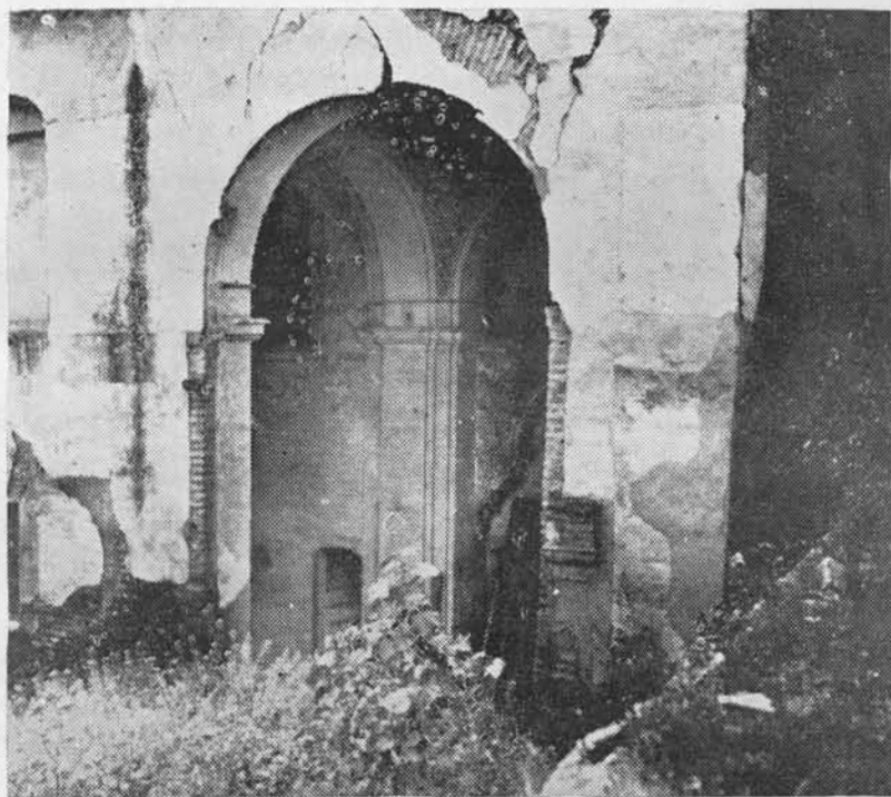
(Fig. 20.) Parte inferior de las mismas ruinas

vender sysçientos maravedís quel dicho ospital tiene de çenso en vn lagar que es a la venta Mora e a casillas pequeñas que son junto al mesmo adarbe do mora vna muger que se dize la Leona, que rrentan quatroçientos e sesenta e çinco maravedís e quiere se caer, e asy mismo vna caldera de cobre grande e