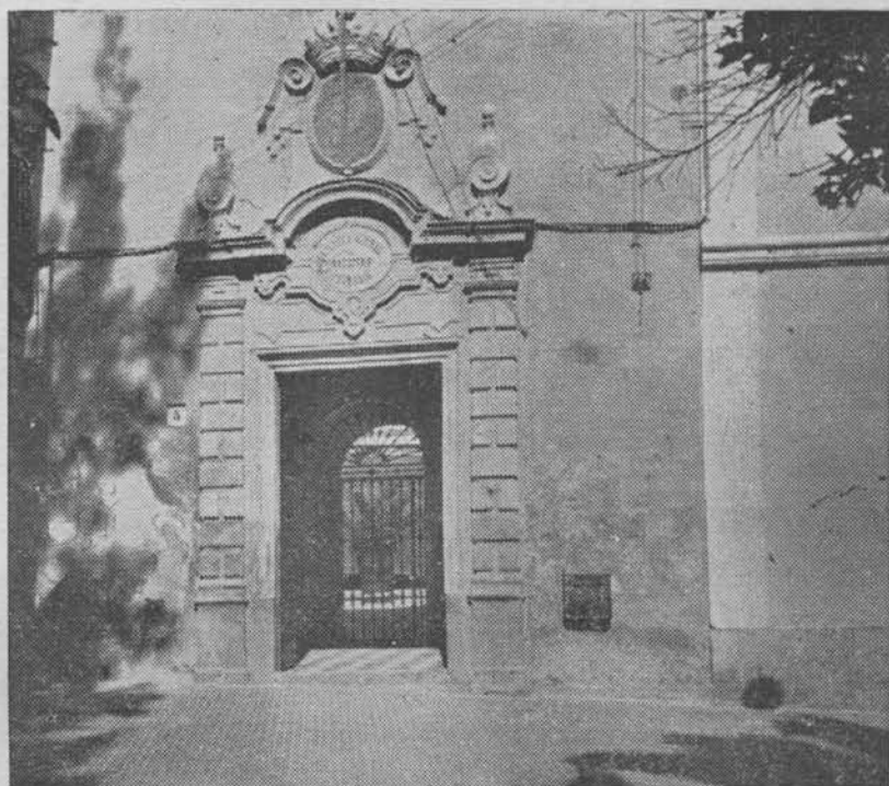
(Fig. 17.) Hospital de Antón Cabrera. Puerta de entrada al mismo, hoy Escuela Normal del Magisterio.

Así dice una exposición sin fecha, pero que parece ser del año 1815. Consecuencia de ésto fué la necesidad de dirigirse en una instancia al Excmo, Sr. Colector de expolios y vacantes, la cual instancia existe en el Archivo de Obras Pías del Cabildo Catedral, y lleva fecha de 1.º de Mayo de 1824; en ella refiére-