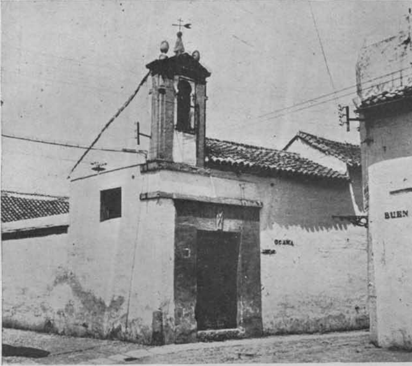
(Fig. 12.) Hospital de San Andrés (Buen Suceso). Sobre la puerta aparece la Cruz aspada de San Andrés

Por una escritura que tenía este hospital, fecha 8 de Febrero de 1551, consta que, en tiempo del Emperador Carlos V, vino a Córdoba un sujeto de su man-