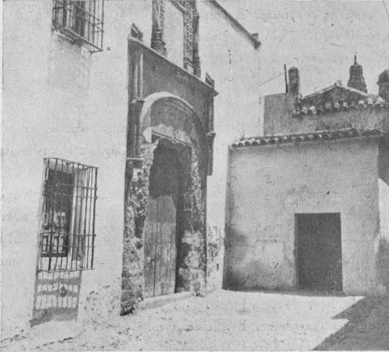
(Fig. 30). S. Pedro Alcántara. Hoy Hospital de Crónicos. Puerta accesoria que en un principio debió ser principal.

el antiguo hospital de la Misericordia, figuraban desde 30 de Abril de 1927, los locos varones, adonde se habían trasladado desde S. Pedro Alcántara. Razones de conveniencia aconsejaron reunir a todos los dementes—hombres y mujeres— en un mismo local destinado exclusivamente a ellos. Efectivamente púsose en práctica tal iniciativa, y el 28 de Enero de 1930 fueron trasladadas las dementes de S. Pedro Alcántara a la Misericordia, quedando desde entonces, hasta el día de hoy, destinado aquel edificio a la asistencia de los enfermos crónicos.