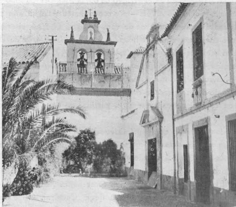
(Fig. 29.) Vista de conjunto—patio, campanario y entrada—del Hospital de la Misericordia, hasta hace pocos años de Crónicos y hoy de Dementes.

Esta Cofradía estaba constituida principalmente por piconeros: por los descendientes de aquellos recios piconeros cuyo retrato tan delicada y amorosa-