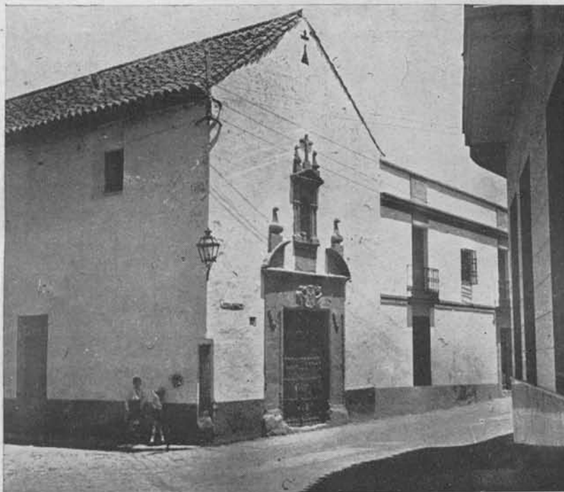
(Fig. 13.) Hospital de Desamparados. Aparece en la fotografía la capilla del mismo

taban instalados los Niños de la Doctrina, a quienes trasladó a este Hospital de los Desamparados. En él estuvieron también provisionalmente los Padres Capuchinos, mientras se edificaba el convento en el que hoy se hallan.