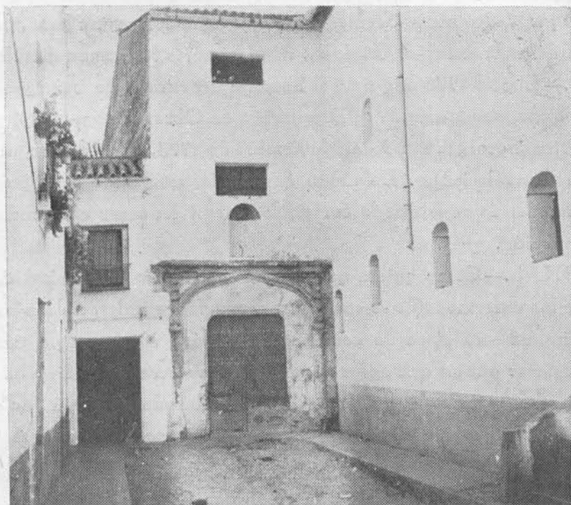
(Fig. 28). Puerta principal de entrada al hospital de Convalecientes de San Francisco. Hoy falsa de Expósitos.

Lindaban por su espalda con el hospital de San Sebastián; y estaba concluido el edificio a 21 de Octubre de 1675, año en el cual fueron aprobadas por el Cabildo las constituciones por las cuales había de regirse el dicho hospital.