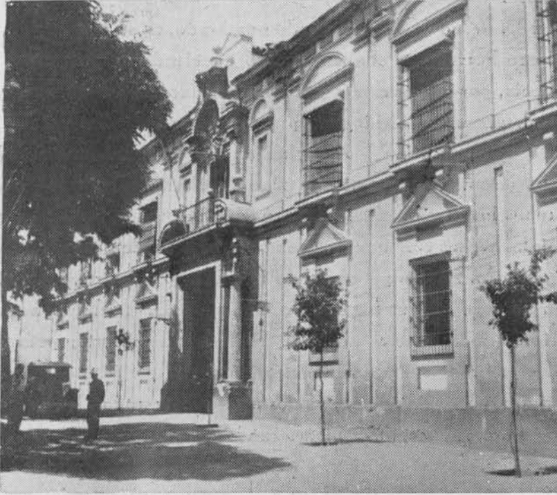
(Fig. 31.) Vista de la fachada principal del Hospital de Agudos, antes del Cardenal.

Del celo con que este señor atendía sus funciones en bien del hospital da idea el dato que sigue: