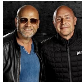
die feisten „jetzt!“ Mittwoch 03.05.2023 20:00 Uhr Radolfzell - Milchwerk Mehr Informationen