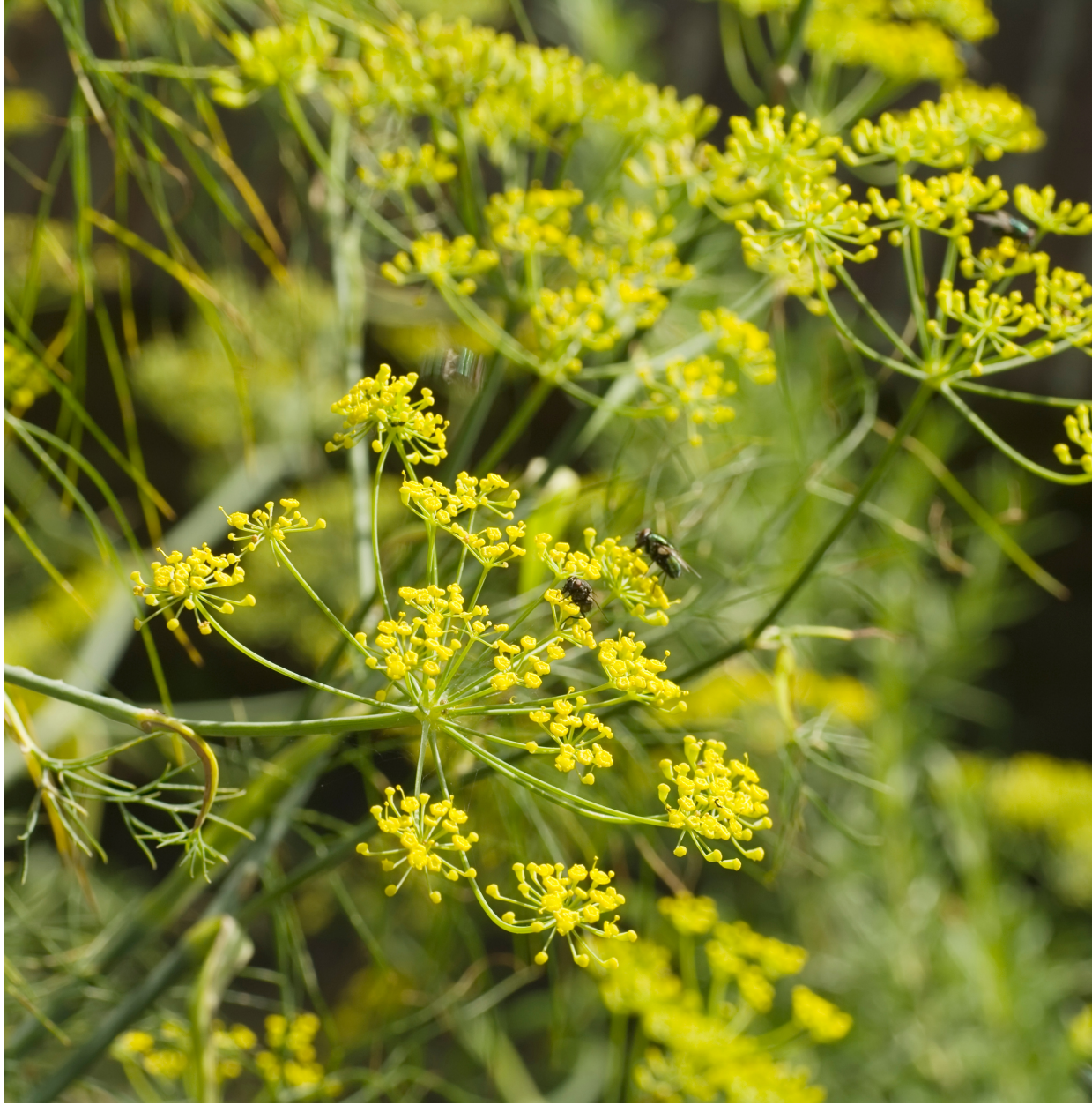
a) E .....F.....

Dies sind Raupenfutterpflanzen des Falters: a) und b) + c) und d) sind jeweils eine Pflanze.