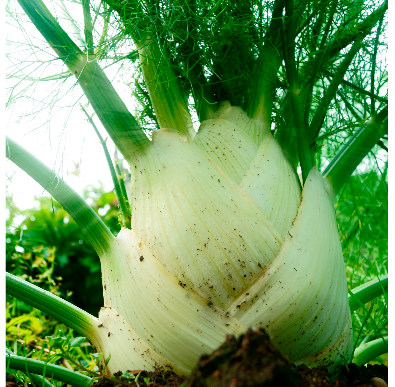
b) E .....F.....