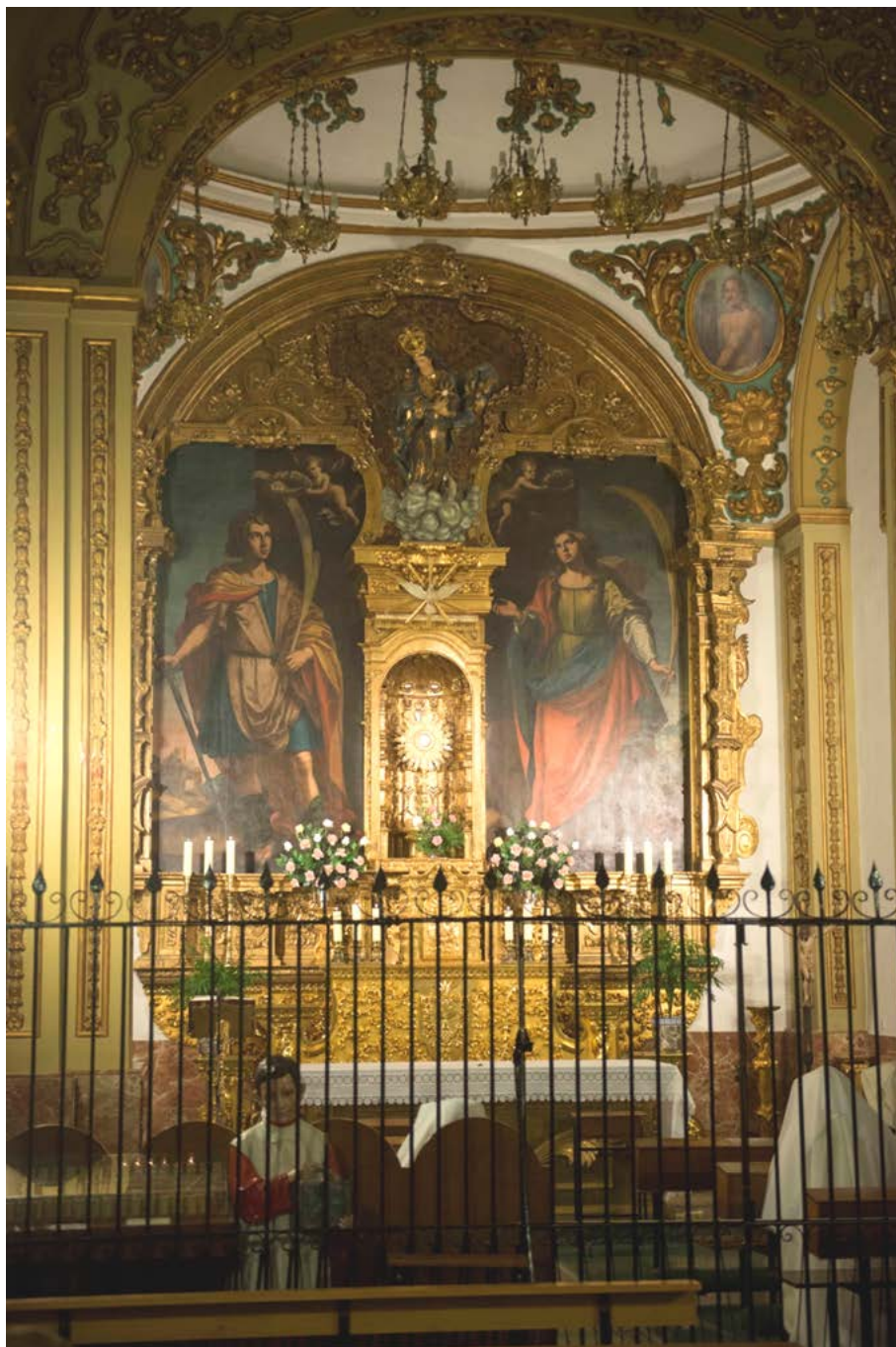
Ermita de los Santos Mártires en la Puerta del Colodro.