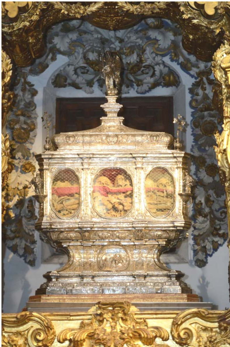
Arca de las reliquias de los Santos Mártires de San Pedro.