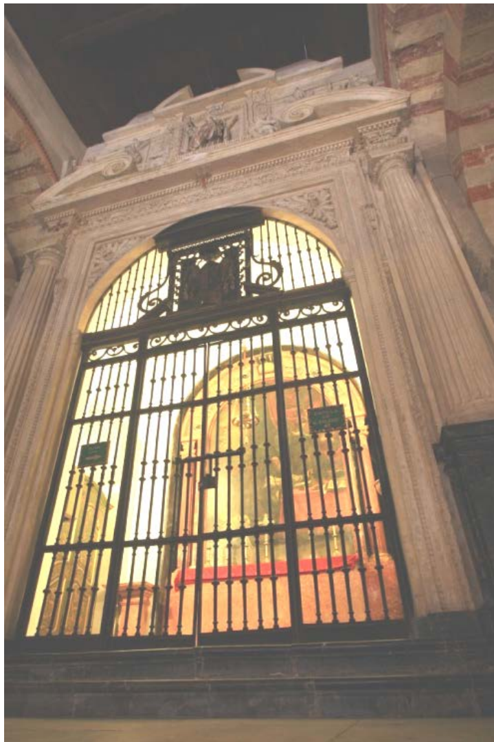
Capilla de San Eulogio en la catedral (foto Sánchez Moreno).