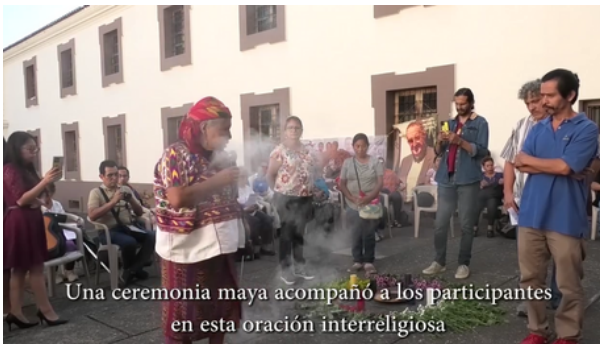
Una ceremonia maya acompañó a los participantes en esta oración interreligiosa

Agradecemos a las congregaciones y miembros de las comisiones que se sumaron a la convocatoria de acompañar a las Mujeres valientes que llegaron a dar su testimonio durante varios días a lo largo del mes de abril.