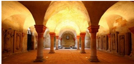
Krypta in der Stiftskirche; Grablege Heinrich I.

Im Jahr 1994 wurde Quedlinburg zum UNESCO-Weltkulturerbe erklärt. Wer heute, nach über 30 Jahren, durch die Altstadt geht, kann sich an den vielen renovierten Fachwerkhäusern erfreuen. Aber diese Altstadt mit den vielen kleinen Geschäften, Kaffees und Restaurants bildet die Kulisse für noch mehr: für die Stiftskirche mit der Grablege Heinrich I. dem Schlossberg, für St. Wiperti mit einer Krypta aus dem 10. Jh. den Münzenberg mit dem Kloster St. Marien, dem alten Rathaus und mehr.