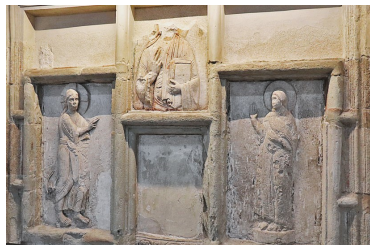
Außenwand mit Jesus und Maria