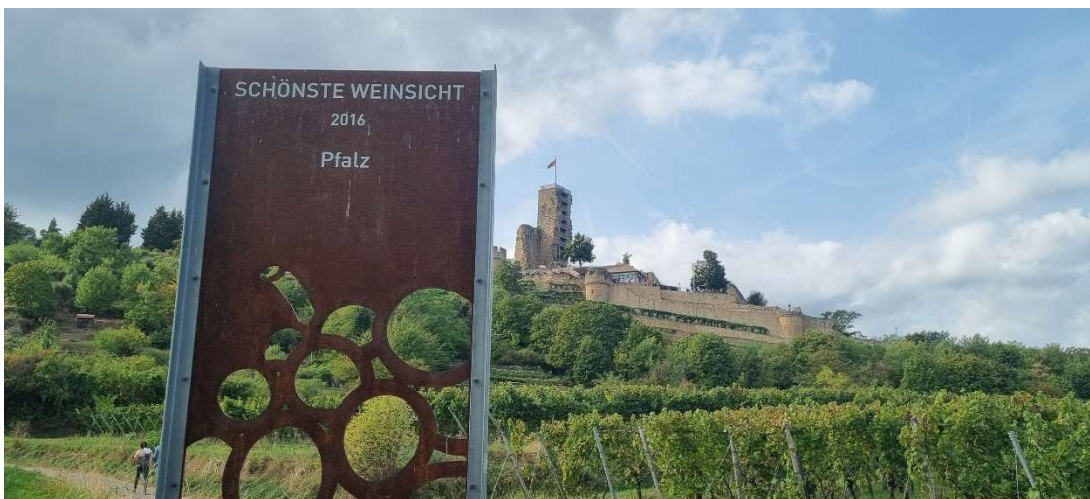
Foto: Blick auf die Wachtenburg

Hier bietet sich uns ein herrlicher Ausblick auf die Burgruine Wachtenburg – unser erstes Etappenziel.